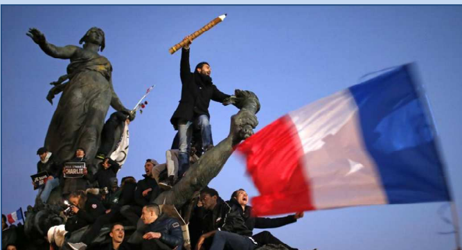
Cliché pris par Stéphane Mahé, photographe de Reuters, le dimanche 11 janvier devant la statue « Le Triomphe de la République » à Paris.